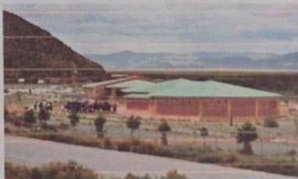
FOTO DEL PARQUE ACUATICO